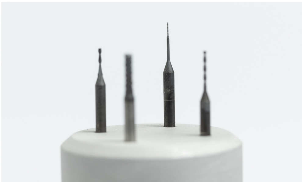
Mit CVD-Diamant beschichtete Werkzeuge.

Auf der Hannover Messe demonstriert das Fraunhofer IST auf dem Fraunhofer-Gemeinschaftsstand im Bereich Produktion (Halle 16, Stand A12) das Potenzial der Schicht- und Oberflächentechnik für die Herstellung nachhaltiger Werkzeuge. Ausgestellt werden u.a. kobaltfreie Hartmetalle für die Zerspanung, standzeitoptimierte Werkzeuge mit CVD-Diamantbeschichtung sowie smarte und resiliente Druckguss- und Umformwerkzeuge.